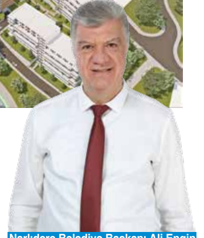
Narlıdere Belediye Başkanı Ali Engin