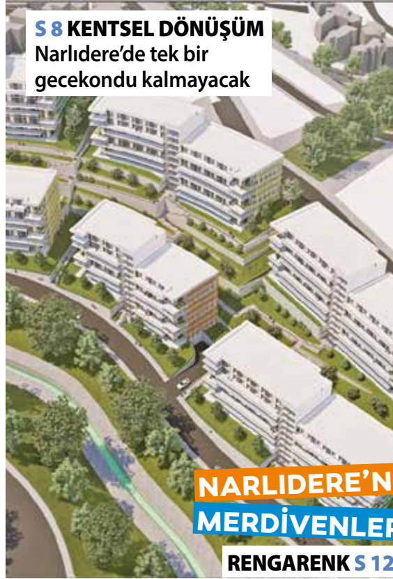
S 8 KENTSEL DÖNÜŞÜM Narlıdere'de tek bir gecekondu kalmayacak