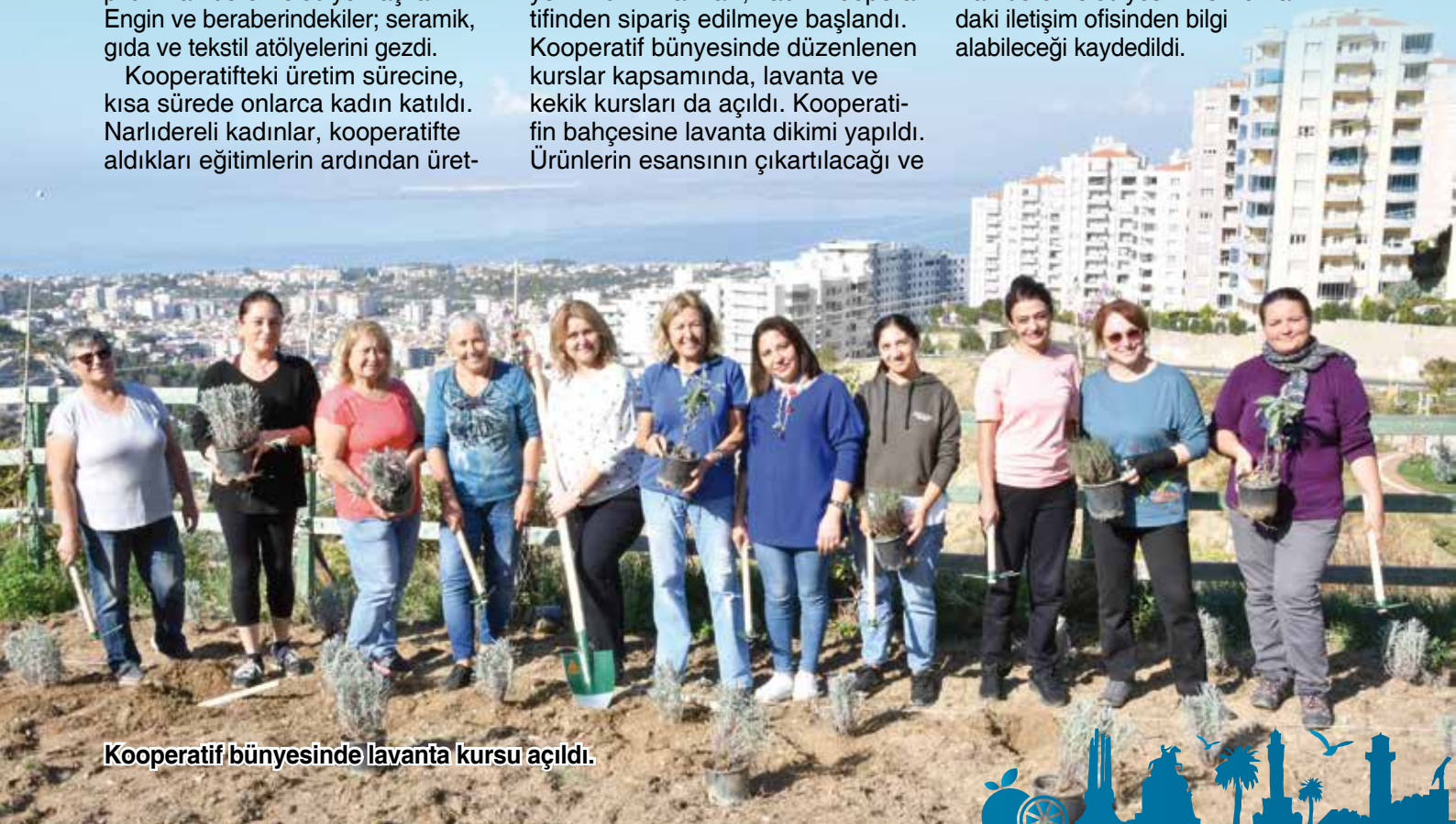
Kooperatif bünyesinde lavanta kursu açıldı.

Denetimli gıda üretiminin gerçekleştirildiği kooperatifte, kooperatif bünyesinde belirli sürelerde açılacak olan kurslara kayıt olmak isteyenlerin, 238 8743 numaralı telefondan ve Narlıdere Belediyesinin 5’inci katındaki iletişim ofisinden bilgi alabileceği kaydedildi.