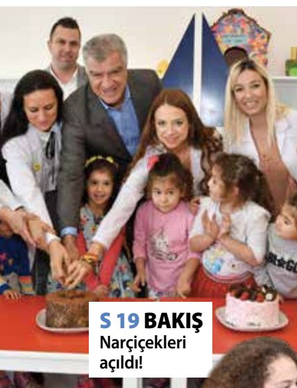
S 19 BAKIŞ Narçiçekleri açıldı!