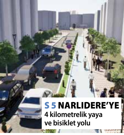
S 5 NARLIDERE'YE 4 kilometrelik yaya ve bisiklet yolu