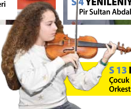
S 13 KÜLTÜR Çocuk Senfoni Orkestrası kuruldu!