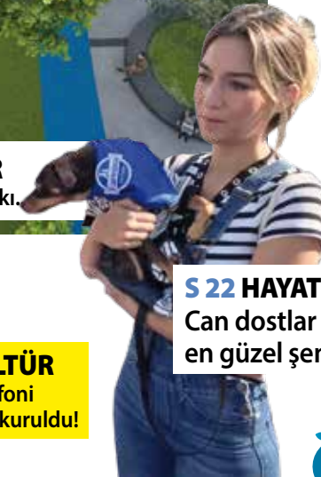
S 22 HAYAT Can dostlar için en güzel şenlik