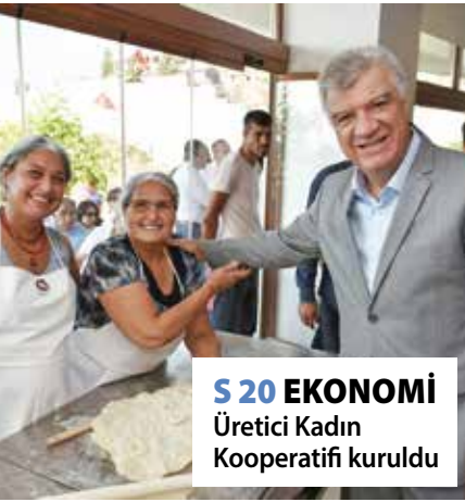
S 20 EKONOMİ Üretici Kadın Kooperatifi kuruldu