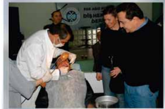
Diş ve Ağız Sağlığı Taraması