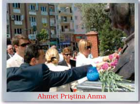
Ahmet Pıřtina Anma