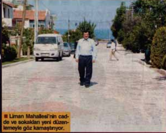
■ Liman Mahallesi'nin cadde ve sokakları yeni düzenlemeyle göz kamaştırıyor.