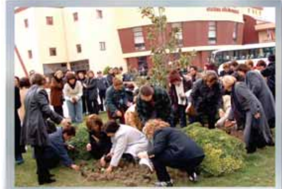
Dünya Kadınlar Günü Ağaç Dikimi