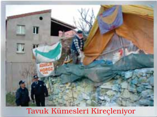
Tavuk Kümesleri Kireçleniyor

PROFLAKTİK KUDUZ AŞISI YAPILMASI : 2005 yılı içerisinde 63 adet proflaktik kuduz aşısının uygulaması oldukça düşük ücretler mukabili yapılmıştır.