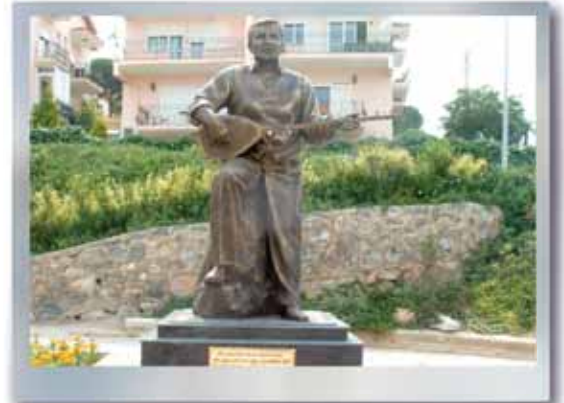
Gençlik ve Çiçek Festivali - Mahsunî Şerif Heykeli Açılışı