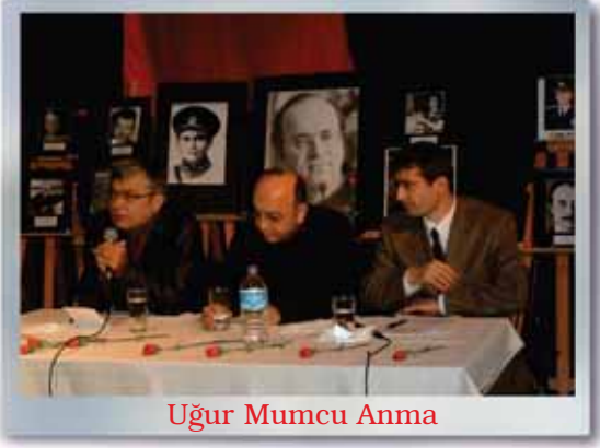
Uğur Mumcu Anma