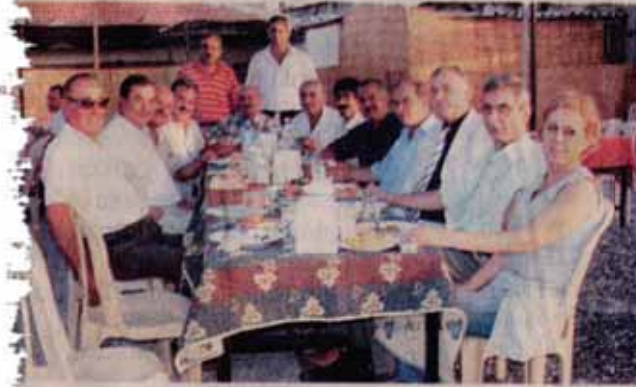
Narlidere Belediye Başkanı Abdül Batur, muhtarlarla yemekte

Narlidere Belediye Başkanı Abdül Batur, muhtarlarla buluştu. 10 muhtardan 9'unun katıldığı yemekte konuşan Batur, "Narlidere halkına hizmet amacıyla sergilediğimiz birlik ve beraberlik için siz mahalle muhtarlarımıza teşekkür ediyorum" dedi. Batur, muhtarlardan belediyenin başlattığı okuma yazma kurslarına, toplu nikah ve sünnetler ile 10 - 16 yaş arası çocukların katılacağı İzmir gezisine katılmak isteyenleri tespit etmelerini istedi. Batur, muhtarların aynı zamanda belediyelerin mahallelerdeki temsilcileri olduğunu da söyledi.