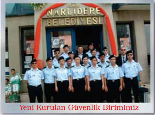
Yeni Kurulan Güvenlik Birimimiz

Belediyemizde Başkan Yardımcısı kadrosuna atama yapılmıştır. Toplam 1981 Gelen, 676 Giden evrak yazışması yapılmıştır.