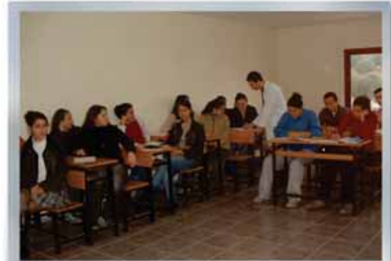
Narbem Ders Saati