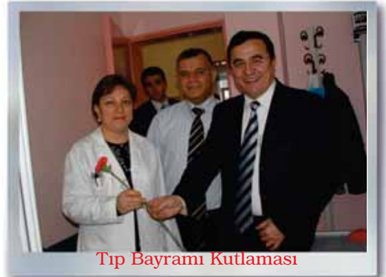
Tıp Bayramı Kutlaması