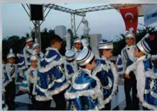
Toplu Nikah - Toplu Sünnet Şöleni