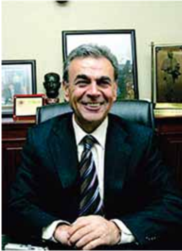
Aziz KOCAOĞLU İ.B.Ş. Belediye Bşk.