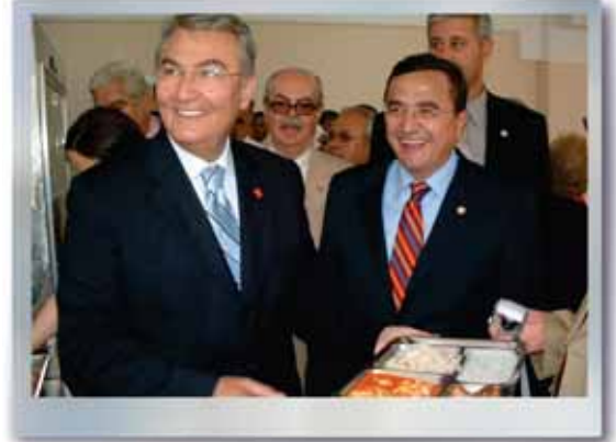
Teknik Hizmetler Binası Açılışı