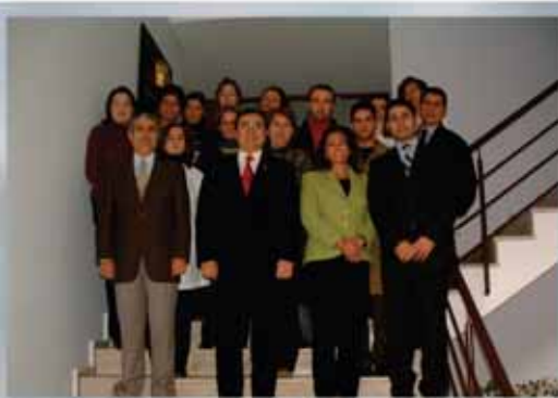
Öğretmen ve İdari Kadro