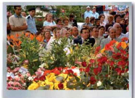
Gençlik ve Çiçek Festivali