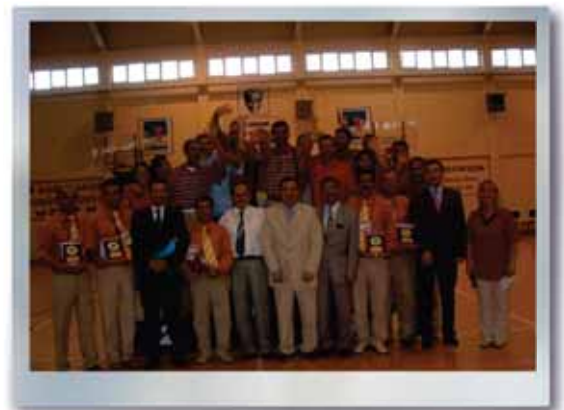
Yarımada Oyunları "Narlıdere 2005"