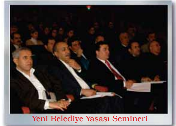
Yeni Belediye Yasası Semineri