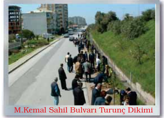
M.Kemal Sahil Bulvarı Turunç Dikimi