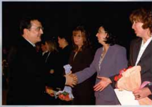
Öğretmenler Günü Kutlaması