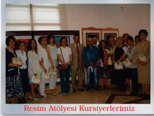
Resim Atölyesi Kursiyerlerimiz

El sanatları, resim, latin dansları, halk oyunları, gitar, saz, keman, piyano, halk müziği korusu, Türk sanat müziği korusu, aerobik, yoga, İngilizce diksiyon ve tiyatro branşlarında toplam 475 kursiyer hobi kurslarından faydalanmaktadır.