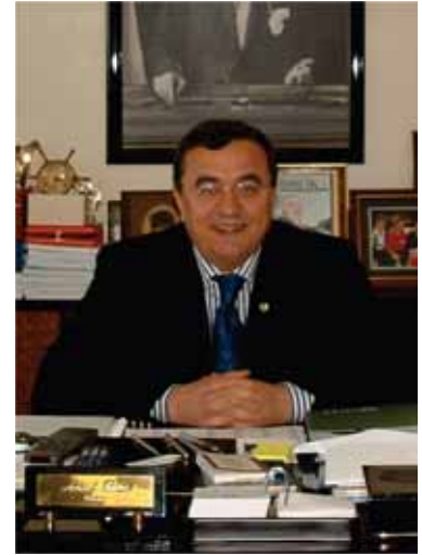
Abdül BATIR NARLIDERE BELEDİYE BAŞKANI