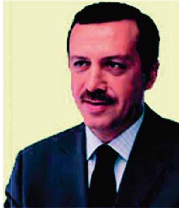
R. Tayyip ERDOĞAN Başbakan