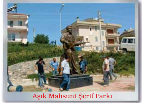
Aşık Mahsumi Şerif Parkı