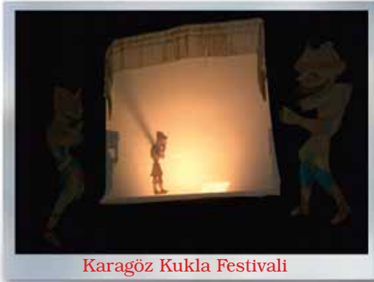
Karagöz Kukla Festivali

27.03.2005: Belediyemiz Tiyatro Topluluğu