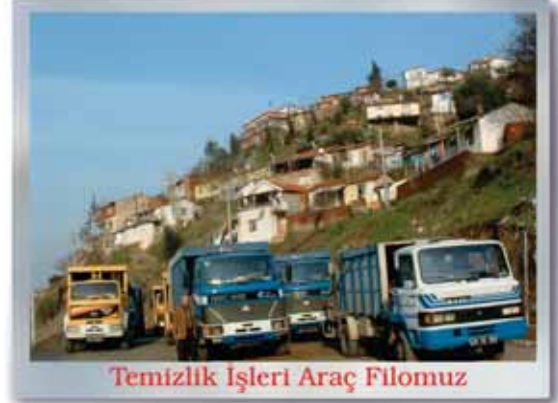
Temizlik İşleri Araç Filomuz

Belediyemiz sınırları dahilinde özellikle kanalizasyon bağlantılı altyapısı bulunmayan mahalle ve semtlerimize yönelik yurttaşlarımızın mağduriyetini önlemek için 1 adet vidanjörümüzle en seri şekilde foseptik çekimi hizmeti verilmektedir.