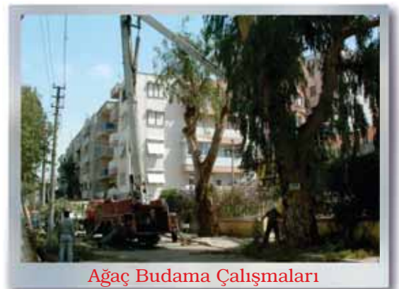
Ağaç Budama Çalışmaları