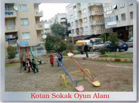
Kotan Sokak Oyun Alanı