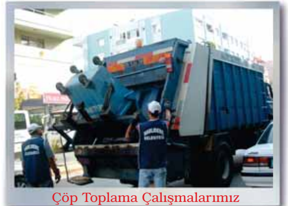
Çöp Toplama Çalışmalarımız