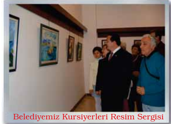
Belediyemiz Kursiyerleri Resim Sergisi