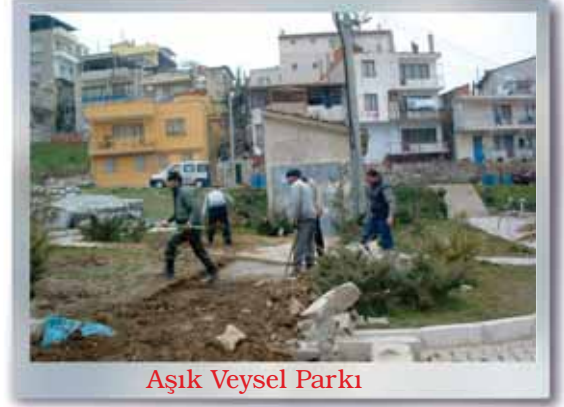
Aşık Veysel Parkı