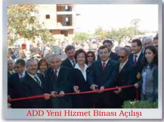
ADD Yeni Hizmet Binası Açılışı