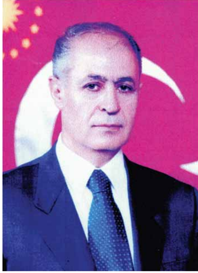
Ahmet Necdet SEZER Cumhurbaşkanı