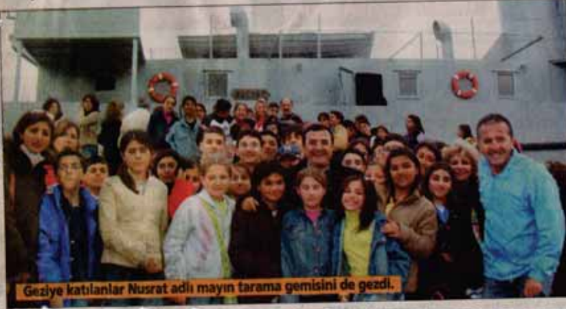
Geziye katılanlar Nusrat adlı mayın tarama gemisini de gezdi.

Narlidere Belediyesi, 500'ü öğrenci 600 hemşehrisini Çanakkale'ye götürdü. Müze, Nusrat Mayın Gemisi, Gelibolu Yarımadası gezildi. Tarih kitaptan değil, yerinde görerek öğrenildi