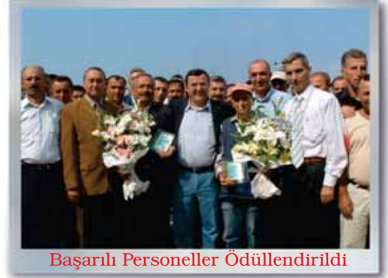
Başarılı Personeller Ödüllendirildi