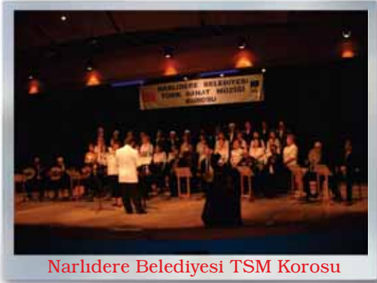
Narlıdere Belediyesi TSM Korusu