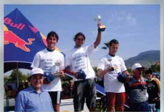
Windsurf Yarışları Ödül Töreni