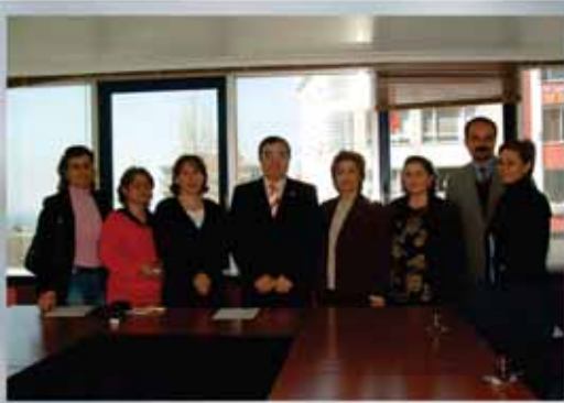
Engelli Tespit Gönüllü Grubu