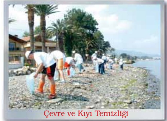
Çevre ve Kıyı Temizliği