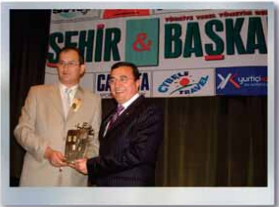
Şehir ve Başkan Dergisi "Kent Yenileme" Dalında Yılın Belediye Başkanı Ödül Töreni