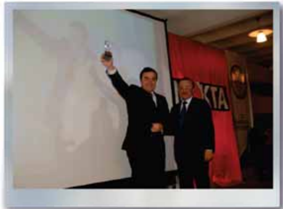
Nokta Dergisi "Doruktakiler" Yerel Yönetimler Dalında Yılın Belediye Başkanı Ödül Töreni