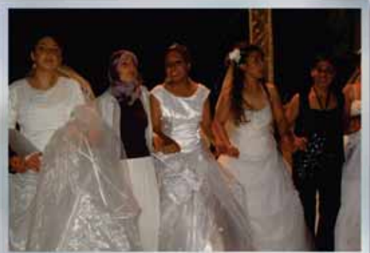
Toplu Nikah - Toplu Sünnet Şöleni