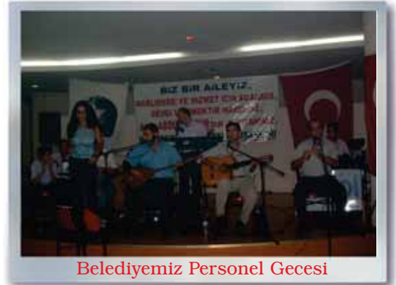
Belediyemiz Personel Gecesi