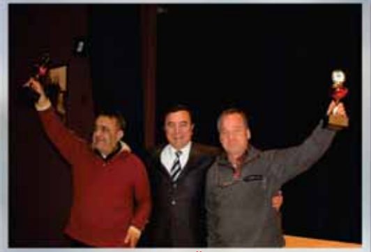
Biriç Kupası Ödül Töreni