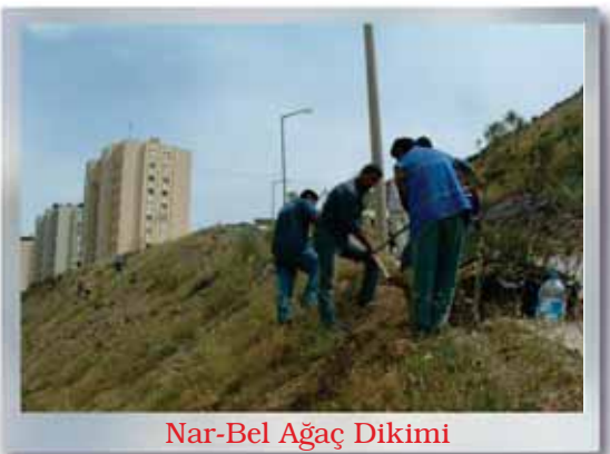
Nar-Bel Ağaç Dikimi