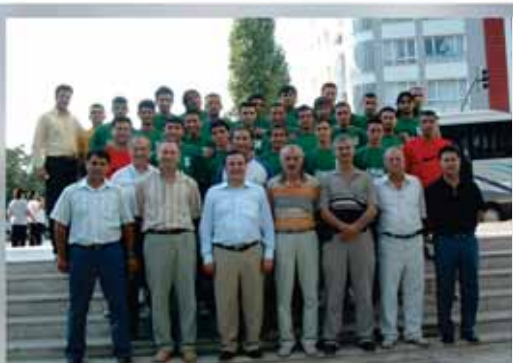
Futbol Sezon Açılışı