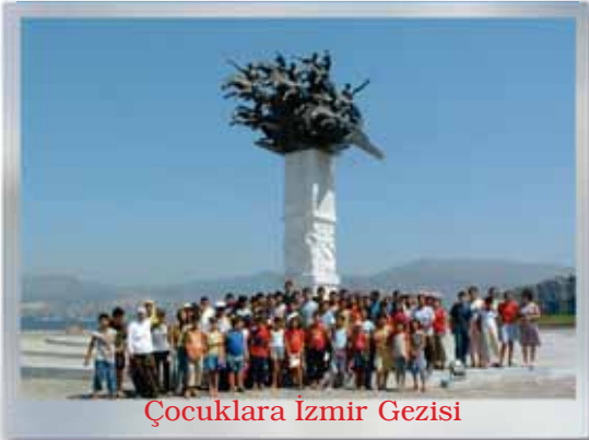
Çocuklara İzmir Gezisi