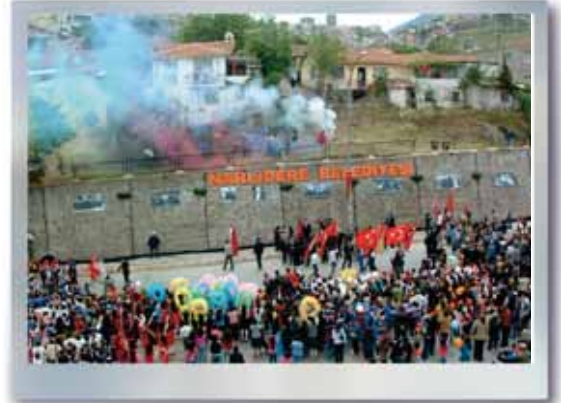
Atatürk Fotoğrafları Açılışı